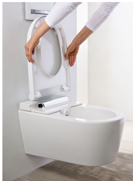
Jednoduché odnímanie WC krytu a sedadla.