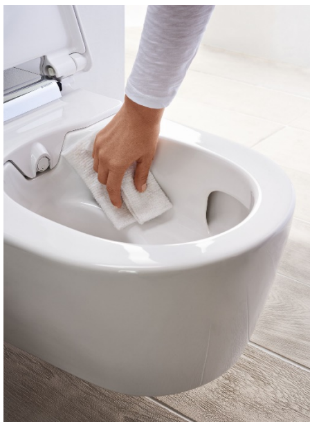
Jednoduché čistenie WC misy bez splachovacieho kruhu.