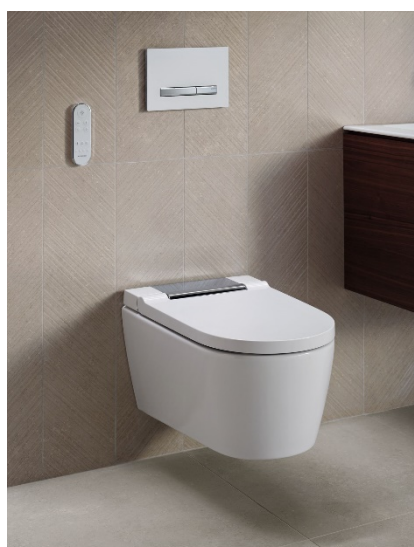
Geberit AquaClean Sela s chrómovým krytom.