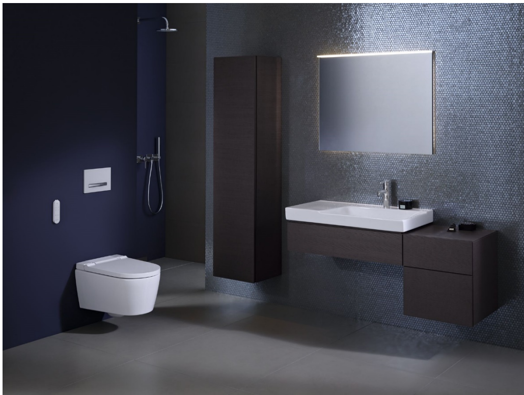
Nové sprchovacie WC Geberit AquaClean Sela je dostupné s krytom z lesklého chrómu alebo s plastovým krytom vo farbe alpská biela.

Prostredníctvom modelu AquaClean Sela rozširuje spoločnosť Geberit sortiment sprchovacích WC AquaClean o dizajnovo orientovaný model, ktorý sa hodí takmer do každej kúpeľne, pričom na prvý pohľad vôbec nie je zrejmé, že ide o sprchovacie WC.