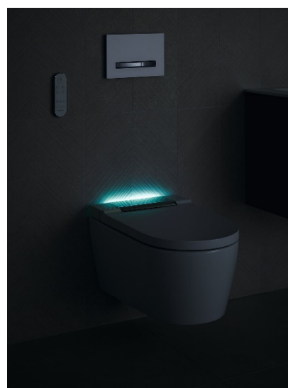
Geberit AquaClean Sela orientačné svetlo v noci.